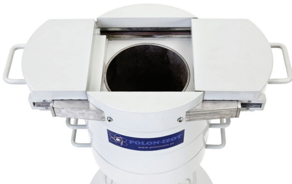
Widok komory pomiarowej.