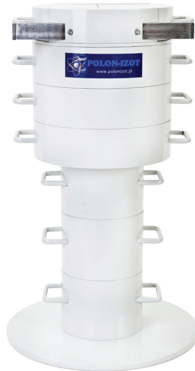
Widok ogólny analizatora.