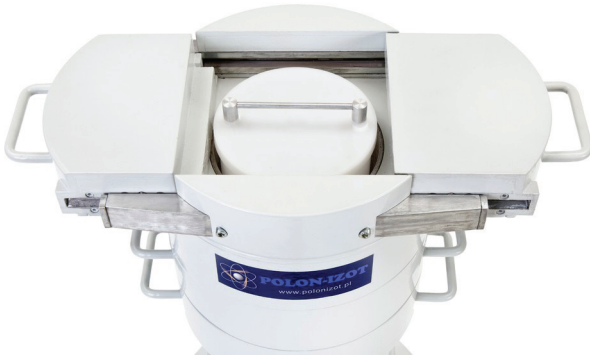
Widok komory pomiarowej z pojemnikiem zawierającym badaną próbkę przed jej zamknięciem.

Istotnym elementem systemu pomiarowego jest komora pomiarowa mieszcząca się w specjalnej ołowianej konstrukcji zwanej domkiem pomiarowym. Domek składa się z szeregu ruchomych, nakładanych na siebie warstw pierścieni ołowianych. To unikatowe rozwiązanie gwarantuje, że cała konstrukcja może być transportowana przez jedną osobę. Po zmontowaniu domek jest stabilny i waży około 260 kg.